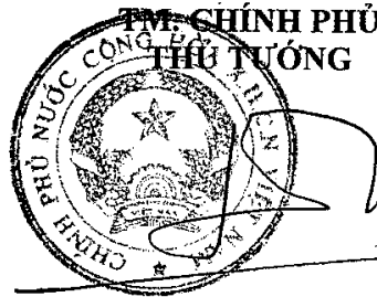
Nguyễn Tấn Dũng